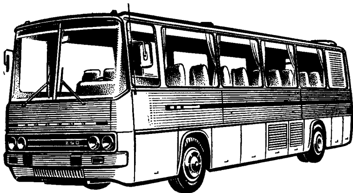
Рис. 27. Автобус «Икарус-250»