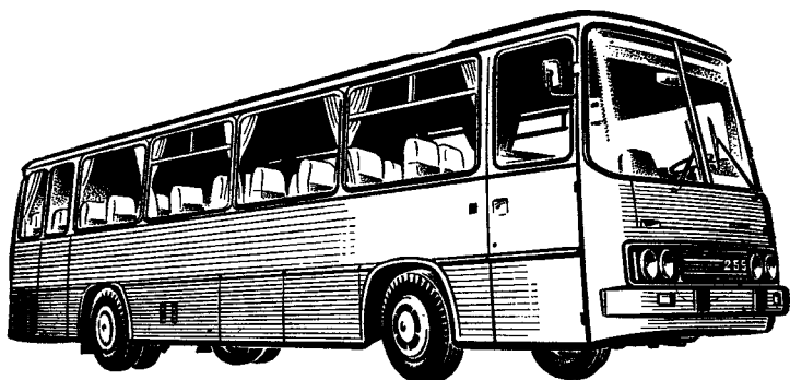
Рис. 29. Автобус «Икарус-255»