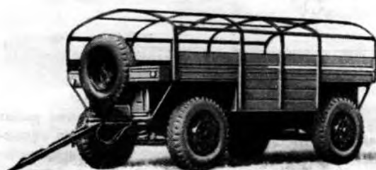
Мод. 810 (2-ПН-4)