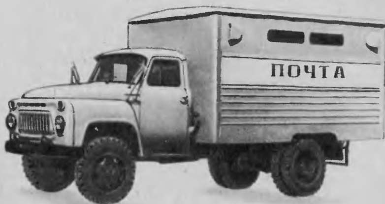
Автомобиль-фургон ГЗСА-3711 (ГЗСА-3712)