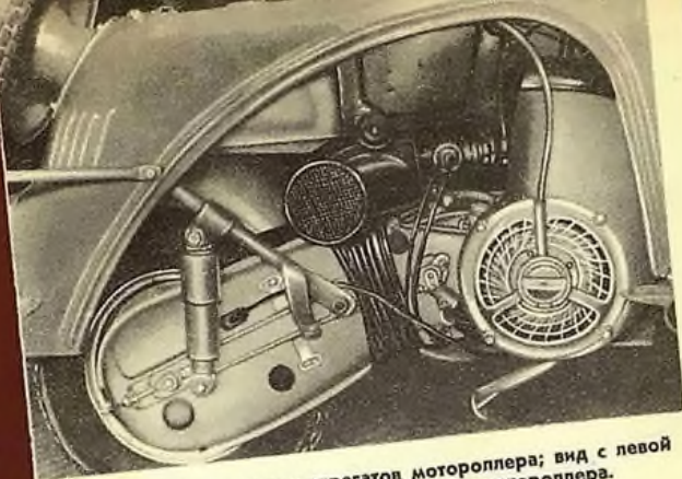
Компоновка узлов и агрегатов мотороллера; вид с левой и правой стороны. Внизу — общий вид мотороллера.