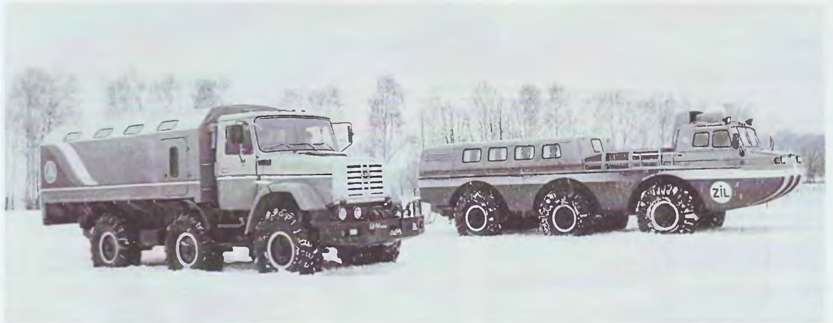
ЗИЛ-4972 и ЗИЛ-49061

Другим не менее интересным проектом конверсии оборонного отдела стала работа над вилочным погрузчиком ЗИЛ-4057. Используя агрегаты от серийных автомобилей ЗИЛ-130 и ЗИЛ-131, в ОГК-СКБ ЗИЛ создано семейство вилочных погрузчиков, оснащенных бензиновым, газовым или дизельными двигателями, оригинальной реверсивной коробкой передач, спроектированной на базе коробки передач ЗИЛ-130, и доработанным ведущим мос-