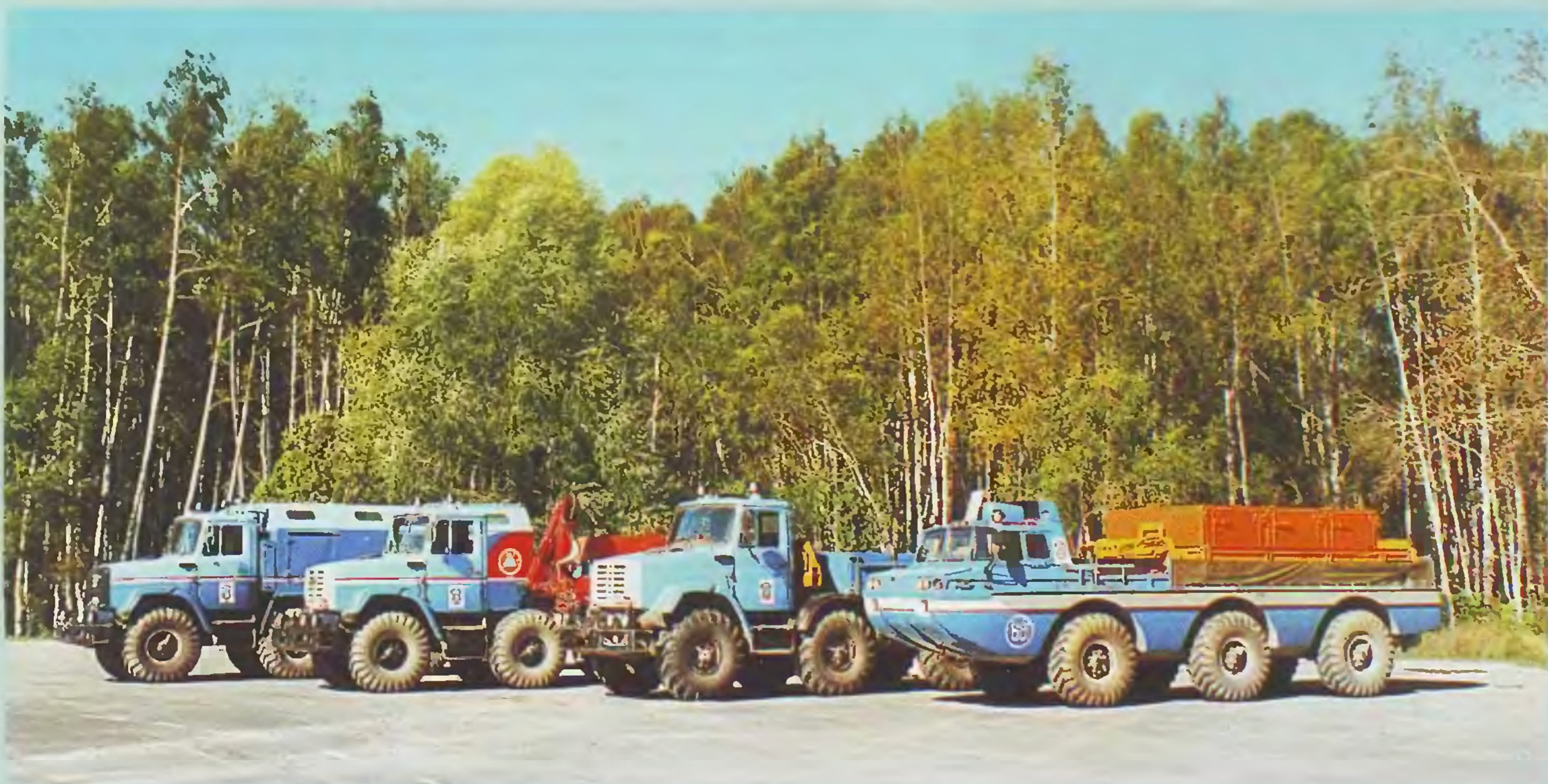
На летних испытаниях 1995 года

Отдельно следует отметить экономические условия, на фоне которых создавались уникальные машины. Акционированный АМО ЗИЛ перешел на четырехдневную рабочую неделю. Задержка заработной платы доходила до девяти месяцев. Автобусы по территории завода не ходили, и каждый день до отдела сотрудникам ОГК через весь завод приходилось добираться пешком. Не удивительно, что численность отдела в этот период сократилась на треть.