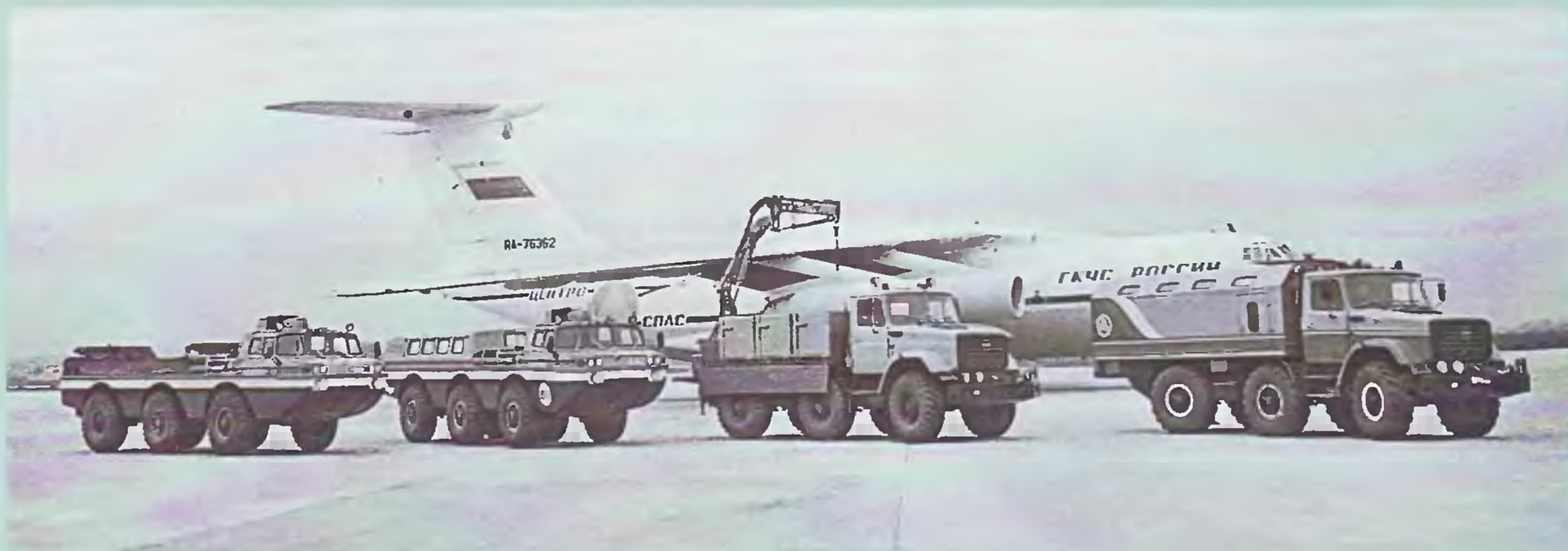
Поисково-спасательные машины ОГК-СКБ на аэродроме ЛИИ им. М.М. Громова (г. Жуковский), 1993 год

том от автомобиля ЗИЛ-131. О качестве машины говорит тот факт, что ее серийное производство в разное время осваивали и на Мценском заводе алюминиевого литья, и на Сердобском машиностроительном заводе, который, отделившись от головного завода, не прекратил выпуск созданного в ОГК–СКБ погрузчика.