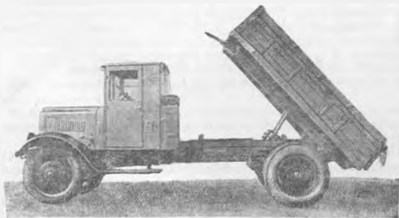
Фиг. 80. Общий вид автомобиля-самовала ЯС-3.

С 1935 г. Ярославский автозавод выпускал 4-тонные автомобили-самосвалы ЯС-3 на базе грузового автомобиля ЯГ-6. Само-