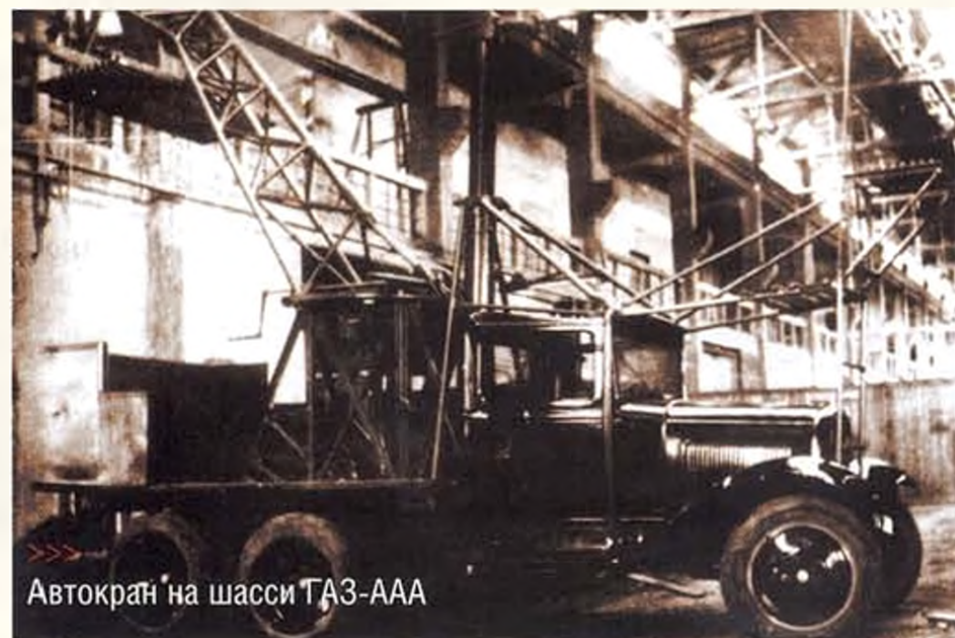
Автокран на шасси ГАЗ-ААА

По конструкции и по рабочим характеристикам АК-3 в основном был аналогичен Январцу и также базировался на шасси ЗИС-6. Наиболее существенным отличием была стрела: несколько большей длины, прямая, а не Г-образная.