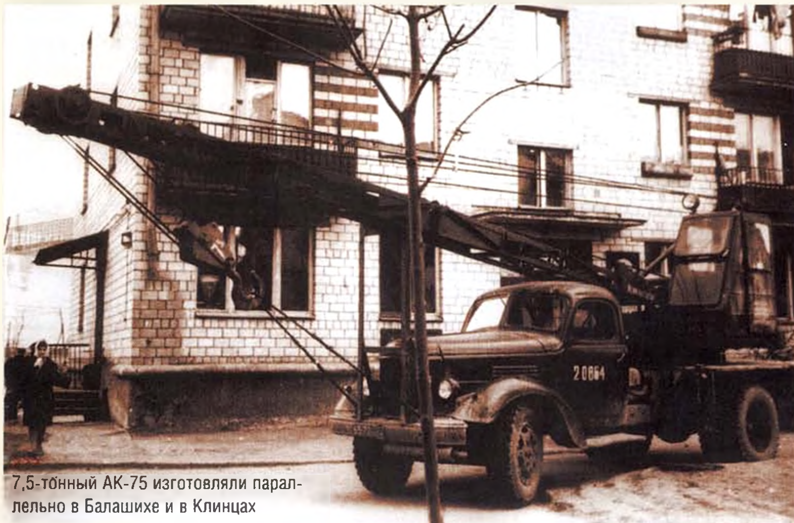
7,5-тонный АК-75 изготавливали параллельно в Балашихе и в Клинцах