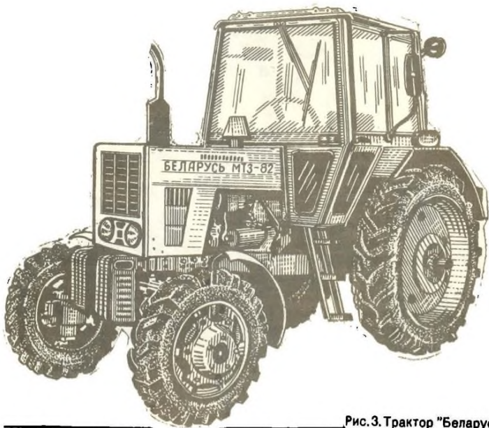
Рис. 3. Трактор "Беларусь" МТЗ-82.