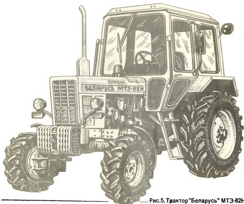
Рис. 5. Трактор "Беларусь" МТЗ-82Н.