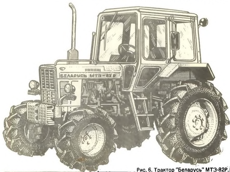
Рис. 6. Трактор "Беларусь" МТЗ-82Р.