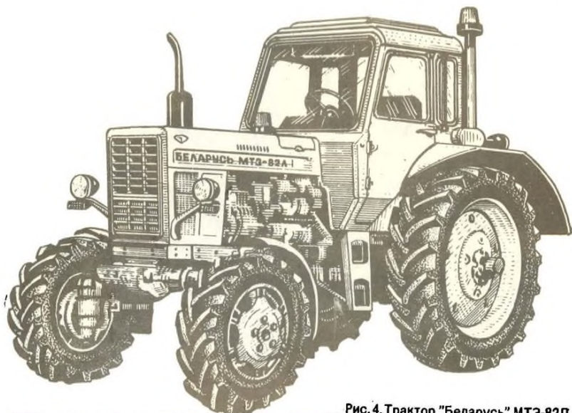
Рис. 4. Трактор "Беларусь" МТЗ-82Л.