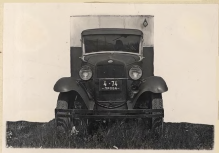
ФОТО № 2.