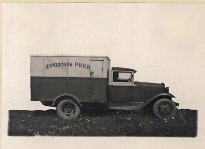
ФОТО № 1.

ОБОРУДОВАННОГО СПЕЦИАЛЬНОЙ УСТАНОВКОЙ ДЛЯ ПИТАНИЯ ДВИГА- ТЕЛЯ СЖИЖЕННЫМ ГАЗОМ.