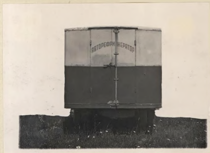
ФОТО № 3.