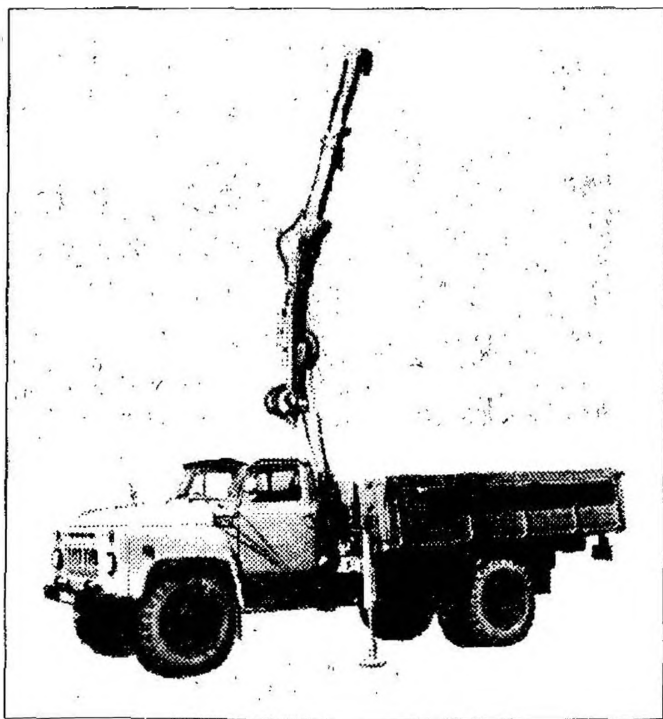
Автомобиль-самопогрузчик мод. 39631 для перевозки контейнеров и пакетированных грузов 4x2.2

Выпускается Целиноградским заводом по ремонту дорожной техники с 1989 г. Предназначен для перевозки автомобильных контейнеров массой брутто 0,625 и 1,25 т и штучных грузов массой до 2,0 т. На автомобиле ГАЗ-53-12 между кузовом и кабиной смонтирован консольный кран с гидравлическим приводом, для чего кузов сдвинут назад и укорочен на 600 мм. Ось поворота гидрокрана смещена влево относительно продольной оси автомобиля на 200 мм. Пульт управления гидрокраном расположен с правой и левой сторон автомобиля кабиной и кузовом. Автомобиль снабжен комплектом грузозахватов: универсальным, вилочным, для металлических бочек, канатным двухветвевым стропом.