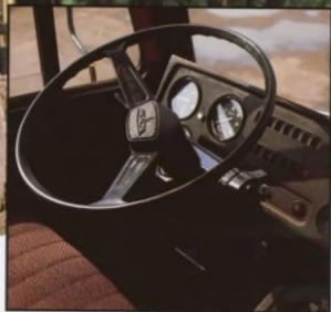
Рабочее место водителя

кирующимся дифференциалом. Планетарные колесные редукторы ведущих мостов обеспечивают требуемые ходовые качества автомобиля-тягача.