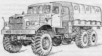
Рис. 1. Общий вид автомобиля КрАЗ-255Б

Трехосный грузовой автомобиль высокой проходимости КрАЗ-255Б (рис. 1) с колесной формулой 6×6 имеет закрытую кабину и платформу, оборудованную дугами и тентом, с откидным