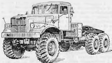
Рис. 2. Общий вид автомобиля КрАЗ-255В

Седельный тягач КрАЗ-255В используется в составе автопоезда в сцепе с полуприцепом, имеющим размеры шкворня по ГОСТ 12017—74.