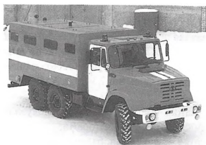
Двери кузовов панельного типа