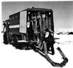
Уборка рукавной линии