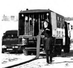
Прокладка рукавной линии