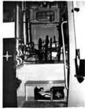
Размещение ПТВ в отсеке