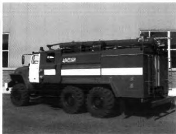
Общий вид 11ВР