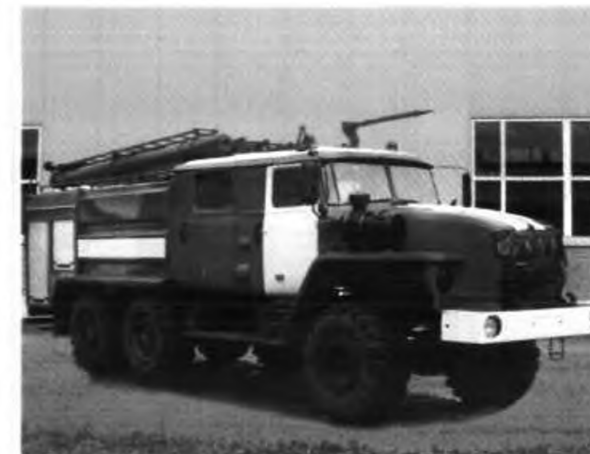
Двери кузовов для ПТВ шторного типа