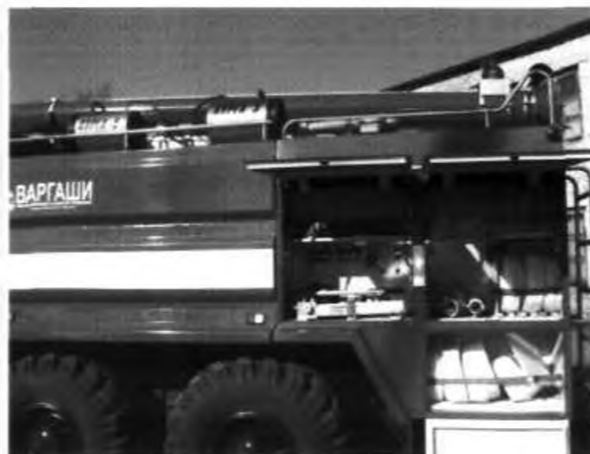
Размещение ПТВ в кузовах и на надстройке