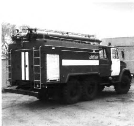
Общий вид надстройки сзади