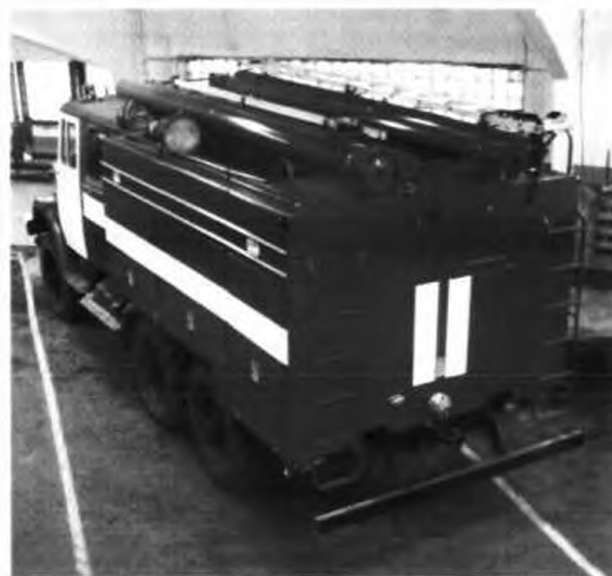
Двери кузовов панельного типа