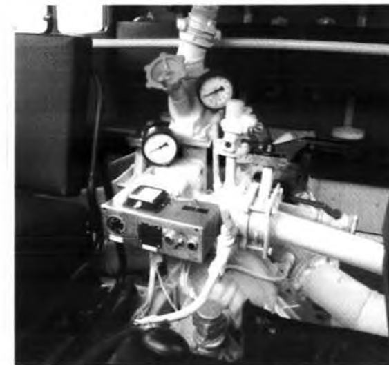
Пожарный насос НЦП-40/100 в КБР