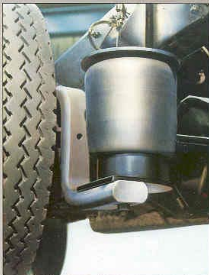
Als extra kan op de achteras Luchtvering worden gemonteerd (uitsluitend bij de acht-, negen- en tientons versies)

En tenslotte opent dit veersysteem de mogelijkheid om in het distributievervoer te gaan werken met afzetbakken. Toepassing van MAN luchtvering op de G-90 betekent een verhoging van de vervoersefficiëncy.