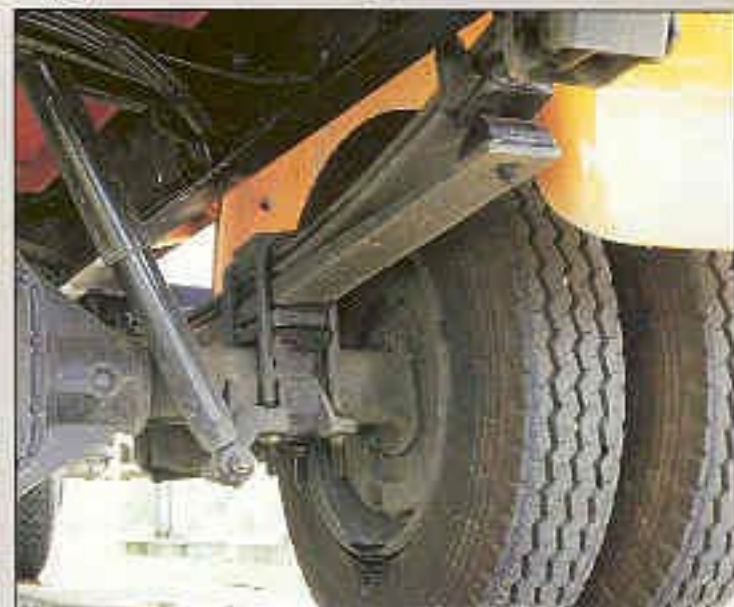
Soepele bladveren geven de MAN G-90 een soepele veerarakteristiek. De bladvering wordt standaard gemonteerd.