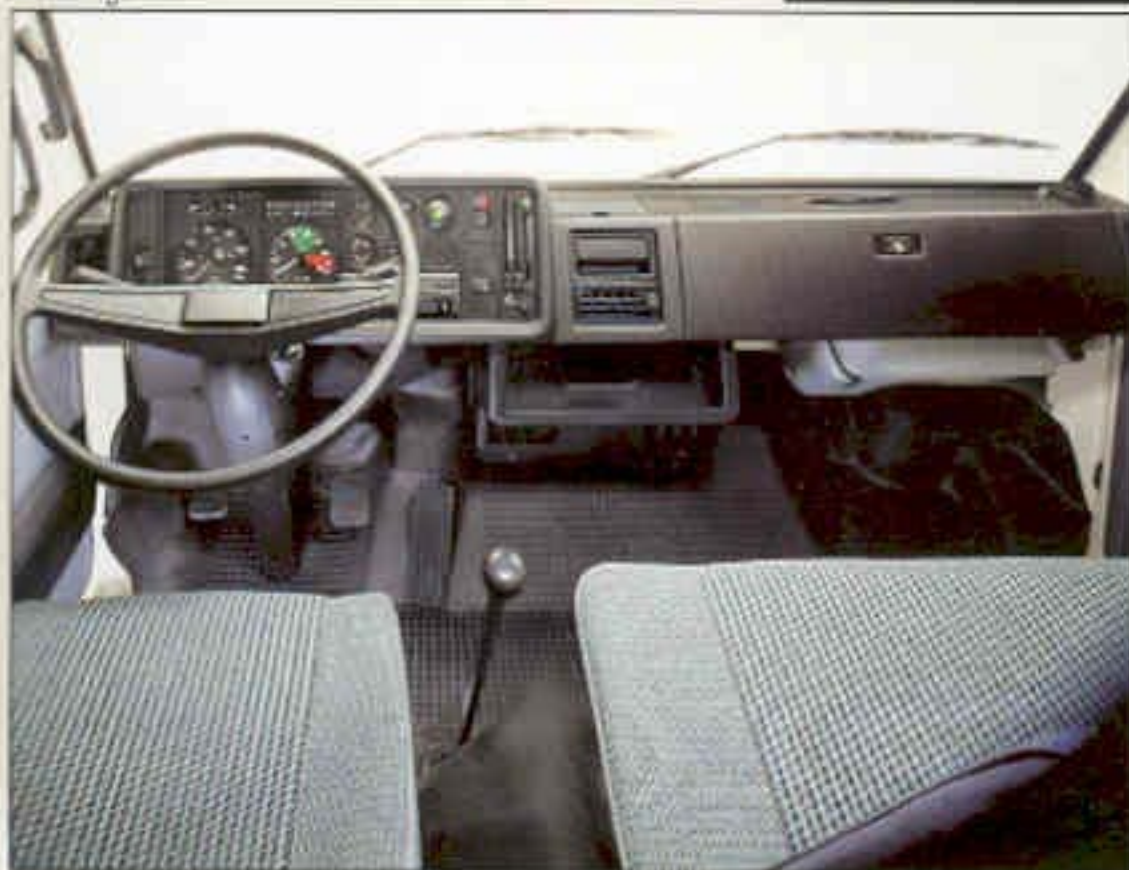
Het "commandocentrum" van de chauffeur. Van hieruit heeft hij de auto of combinatie volledig onder controle.