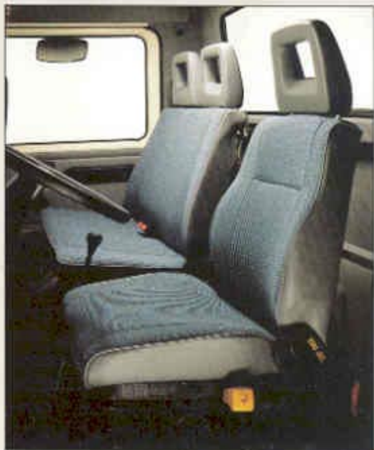
De twee stoffen bekleding en de hoofdsteun op de bestuurdersstoel zijn standaard.

De MAN G-90 is voorzien van een vijfversnellingsbak die geheel gesynchroniseerd is. De pedaaldruk voor koppeling en rem is gering en daarom kan met de MAN G-90 zo soepel worden gereden.