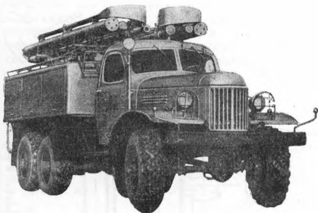
Рис. 46. Пожарный автомобиль химического пенного пожаротушения АХП-2,4(157) на шасси ЗИЛ-157К

В средней части шасси автомобиля установлен бункер для пеногенераторного порошка. Внутри бункера смонтированы два шнека для подачи порошка к пеногенератору и четыре рыхлителя.