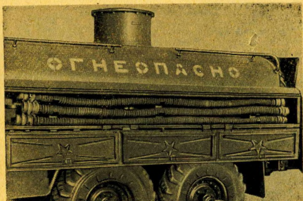
Автоцистерна АЦМ-4-157. Вид на правый открытый ящик

заправку машин фильтрованным горючим с замером раздаваемого количества и перемешивание горючего в своей цистерне с целью приготовления смесей.