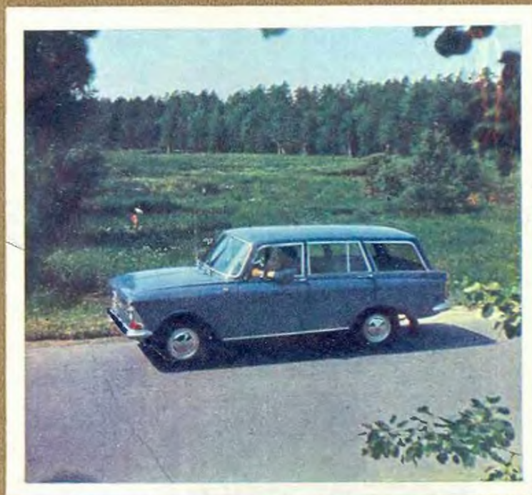
Наиболее распространенная сегодня в нашей стране модель универсала — «Москвич-426». Он вмещает пять человек без багажа, или четырех человек и 120 кг багажа, или же двух человек и 260 кг груза.

Пятидверный ВАЗ-2102 является грузо-пассажирским вариантом хорошо известного седана «Жигули». Задняя дверь снабжена наружным замком.