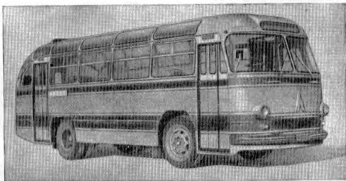
Автобус ЛАЗ-695Б «Львов»