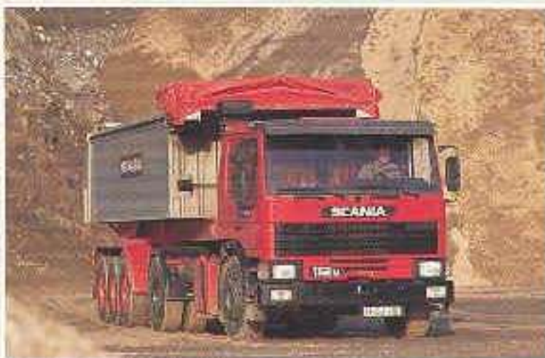
Scania P112 MA 4x2 Sattelzugmaschine mit Kippaufleger.