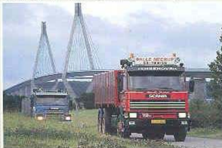
Scania P112 H 6x2 Pritschenwagen.