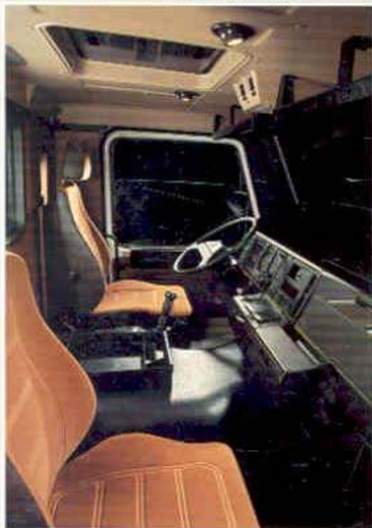
Die Normalkabine mit Beifahrersitz.