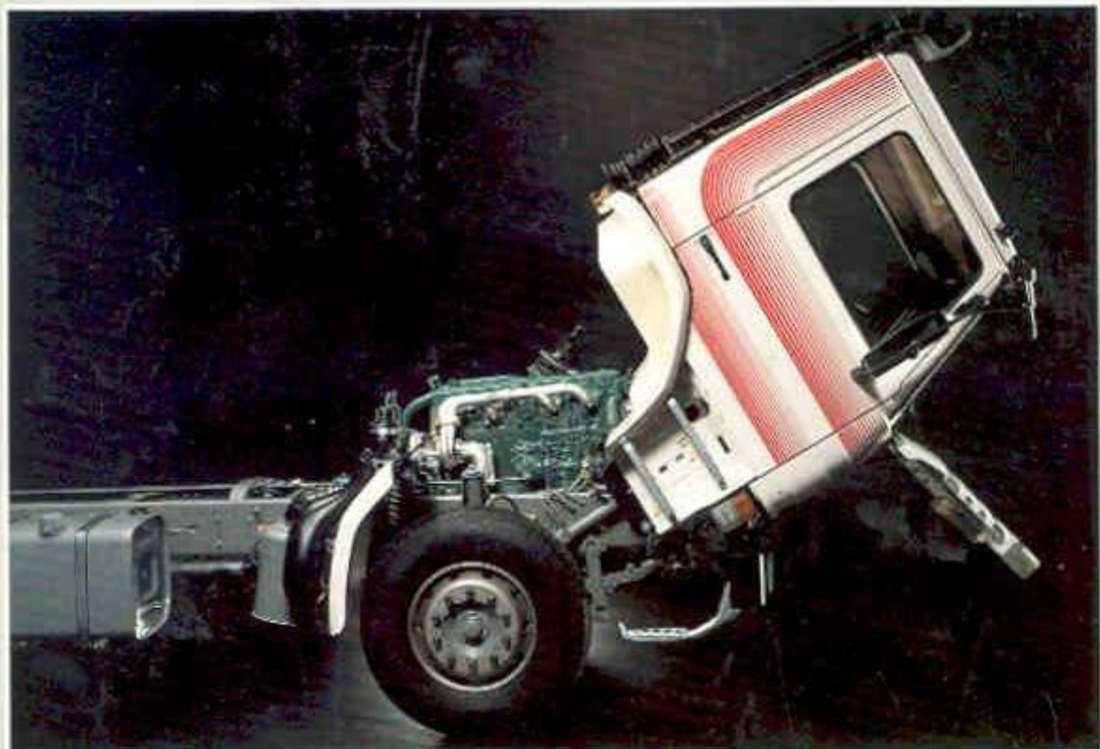
Leichter und bequemer Schicht bei gekipptem Fahrerhaus