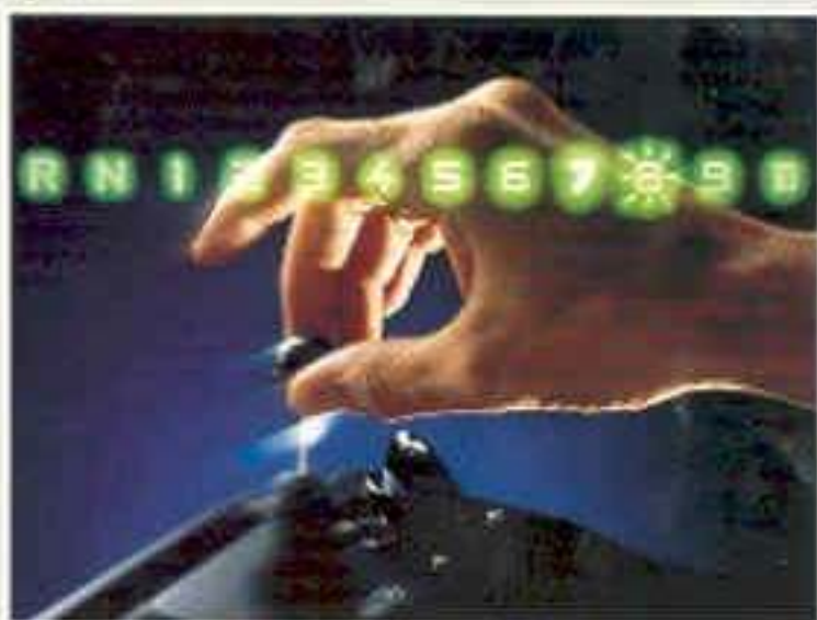
Die Anzeige (Display) des Schmitz DAG.