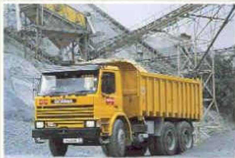
Scania P112 E 6x4 Muldenkipper