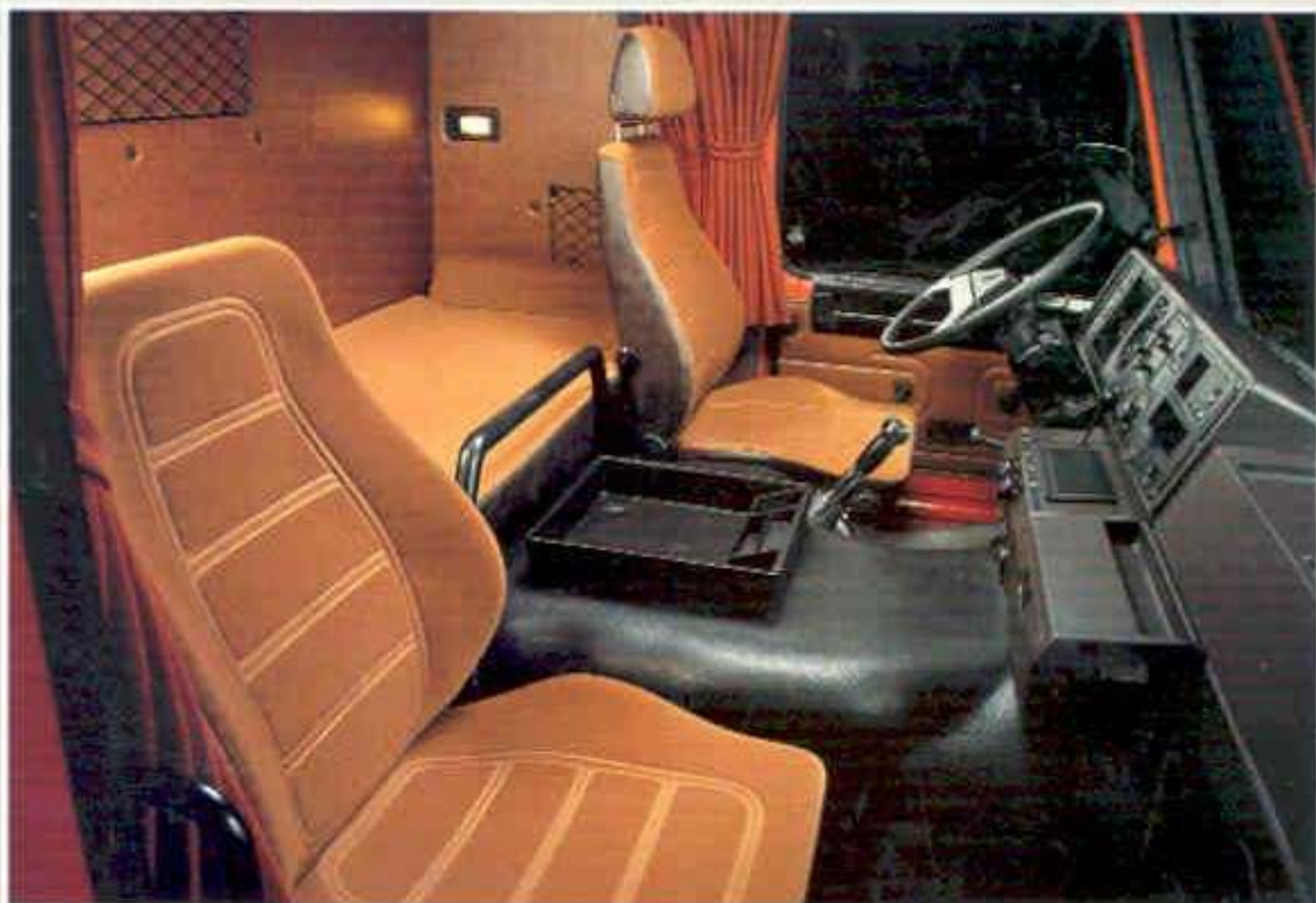
Das Fernführerhaus zeichnet sich durch ein großzügiges Platz- und Komfortangebot aus.