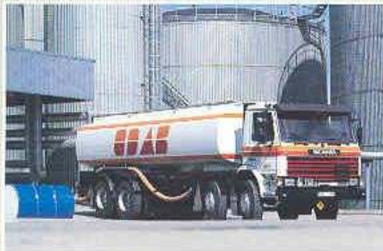
Scania P112 H 8x2 mit Tankaufbau.