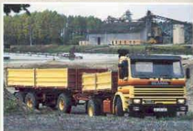
Scania P112 H 4x2 Pritschenwagen mit Anhänger