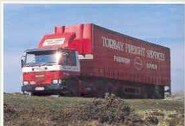
Scania P112M 6x2 Sattelzugmaschine mit Kofferaufleger