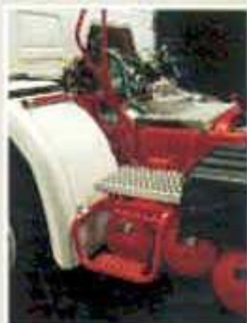
Trittschule und Arbeitsplattform bei Sattelzugmaschinenfahrplätzen.