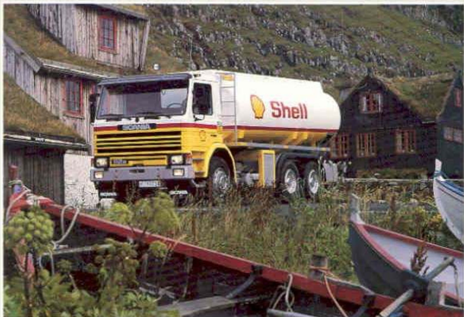
Scania P112 H 6x2 mit Tankaufbau