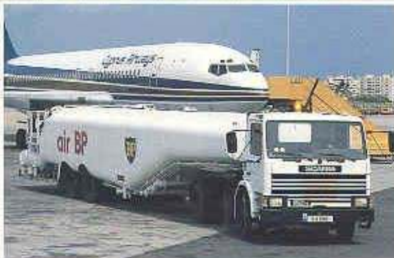
Scania P112 MA 4x2 Sattelzugmaschine mit Tankaufleger.