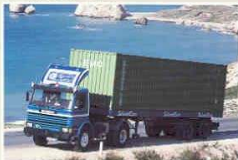
Scania P112 H 4x2 Sattelzug mit Pritschenauflieger