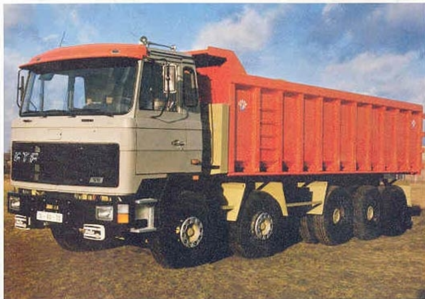
10 x 4 Kipper uitvoering

Vraag vrijblijvend onze offerte aan voor normaal en speciaal transportmateriaal. Aan Uw speciale eisen en wensen zullen wij alle aandacht besteden.