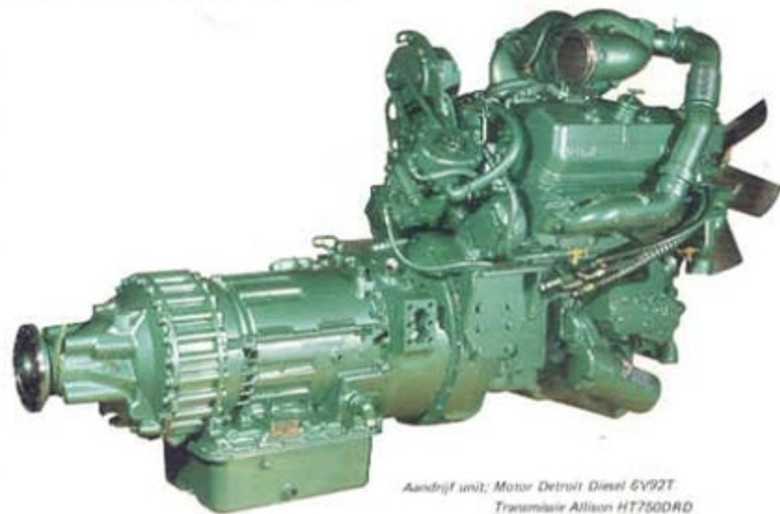
Aandrijf unit; Motor Detroit Diesel 6V92T. Transmissie Allison HT760DRD