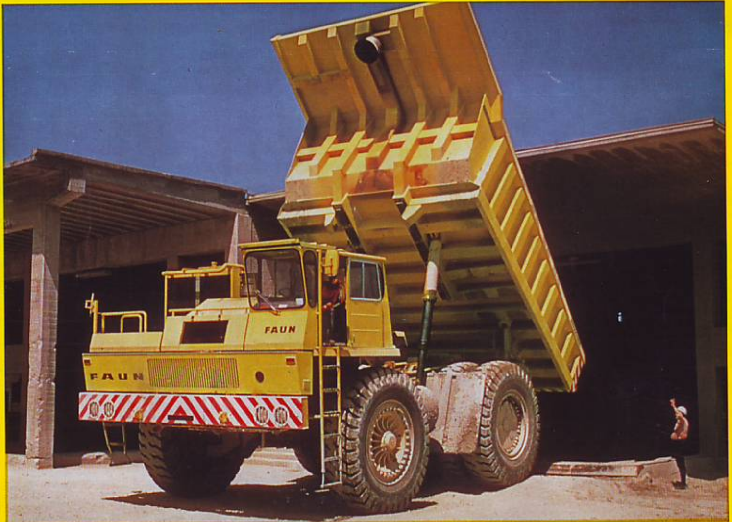
Muldenkipper FAUN K 85.8