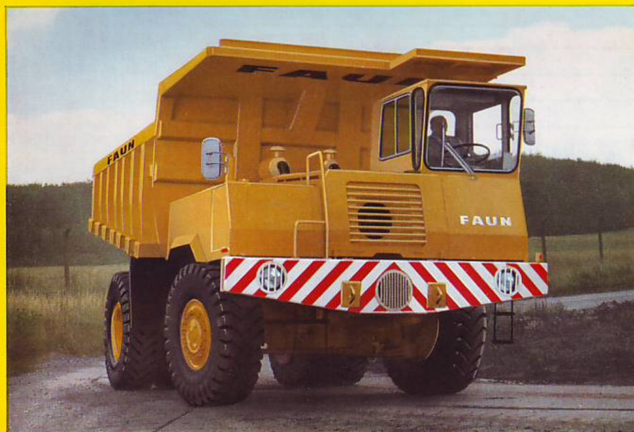
Muldenkipper FAUN K 31.3