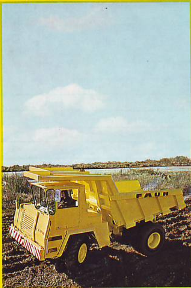
Muldenkipper FAUN K 24.2