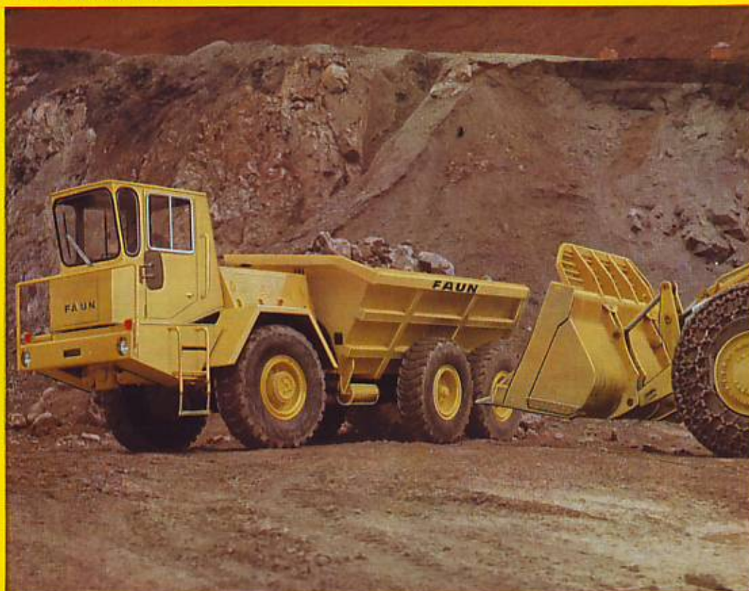
Muldenkipper FAUN K 22.2