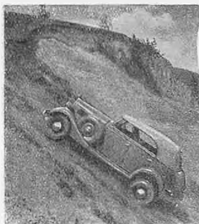
Автомобиль на "крутом подъеме в 38°