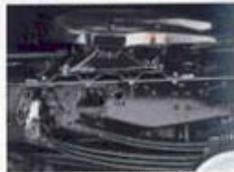
De hoog belastbare paraboolveiling, mogelijk van 1-2,93 in combinatie met laagverbruik mogelijk. Dit - en de toepassing van EPS - vermindert het brandstofverbruik, verlengt de levensduur van de apparaten en zorgt voor meer economie.