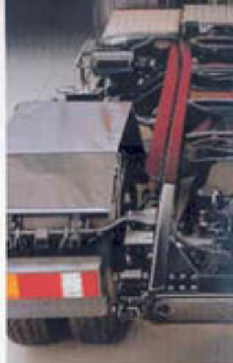
Met in gewicht geoptimaliseerde chassis.

Daarom biedt Mercedes-Benz met de nieuwe Zware Klasse nu nog meer keuze-mogelijkheden bij de samenstelling van de aandrijving. Door het scala van alle aangeboden typen en typevarianten kunt u bij de combinatie van motor, versnellingsbak en versnellingsbak steeds de voor uw gebruik meest geschikte, optimale samenstelling kiezen. Zo is bijvoorbeeld een totale reductie in de