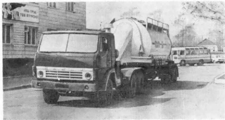
Автокормовоз АСП-25 для перевозки комбикормов.

Ведущую роль в становлении и развитии предприятия выполняет партийная организация предприятия. Сейчас она насчитывает почти 300 членов КПСС. Коллективу есть чем гордиться. За успехи в социалистическом соревновании, производство важнейших видов продукции для животноводства и кормопроизводства предприятие дважды награждалось переходящим Красным Знаменем ЦК КПСС, Совета Министров