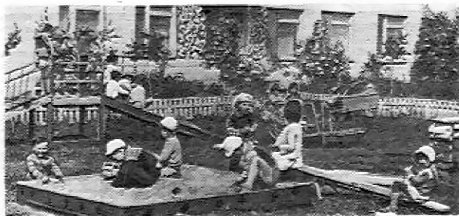
На предприятии проявляется большая забота о детях рабочих. На фото — детский садик «Белочка» на 140 мест.

СССР, ВЦСПС и ЦК ВЛКСМ. Тринадцать кварталов коллектив выходит победителем социалистического соревнования среди предприятий Минмаша СССР. Большие задачи стоят перед коллективом по претворению в жизнь решений XXVI съезда КПСС, Продовольственной программы страны. С целью наращивания мощностей по производству машин для животноводства, решением правительства с 1982 года предусматривается расширение предприятия. Уже начато первую очередь реконструкции завода, сметная стоимость которой более 55 млн. рублей. По существу это будет второе рождение завода. Объем производства продукции для сельского хозяйства возрастет до 67 млн. рублей в год. На предприятии сделано много для повышения культуры производства, улучшения жилищных и бытовых условий, организации культурного отдыха рабочих.