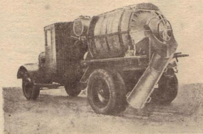
Рис. 172. Автобетономешалка-развозка * емкостью 1500 л Модель СССР-738 (С-49)