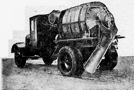
Рис. 172. Автобетономешалка-развозка емкостью 1500 л Модель СССМ-738 (С-49)