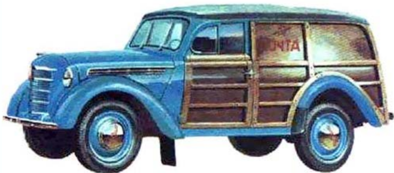
Габаритные размеры Москвича М-400-420