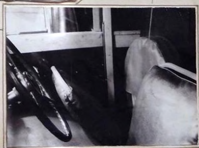
Установка запасного колеса специального кузова