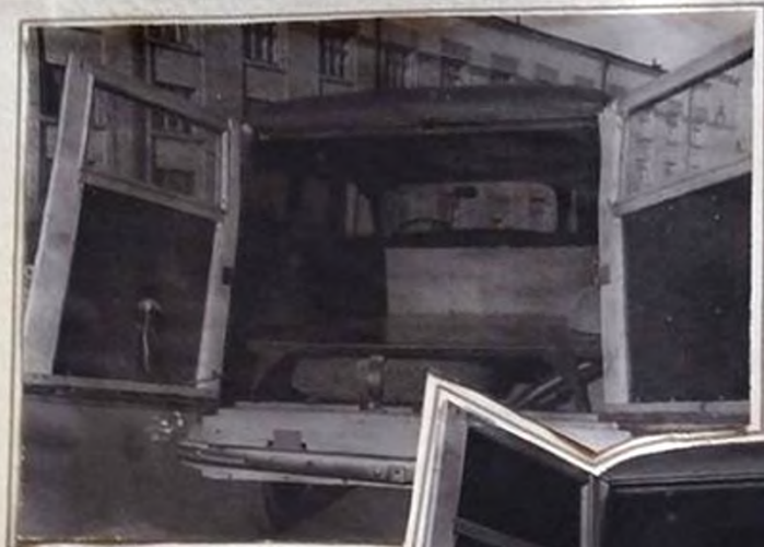
Грузовое отделение стандартного автомобиля "Фургон"