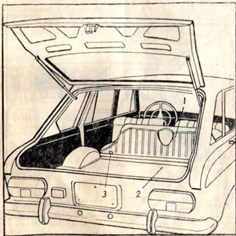
Рис. 1. Автомобиль ИЖ-2125 в грузопассажирском варианте: 1—подушка сиденья; 2—спинка сиденья; 3—рукоятка замка спинки заднего сиденья

Автомобиль ИЖ-2125 с закрытым, цельнометаллическим, несущим, пятидверным кузовом предназначен для перевозки четырех человек (включая водителя) и багажа не более 70 кг. При отсутствии багажа в поездках по дорогам хорошего качества автомобиль может быть использован для перевозки пяти человек. При разложенном заднем сиденье автомобиль может быть использован для перевозки двух человек, включая водителя, и груза не более 210 кг.