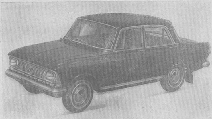
Рис. 1. Автомобиль «Москвич» модели 412