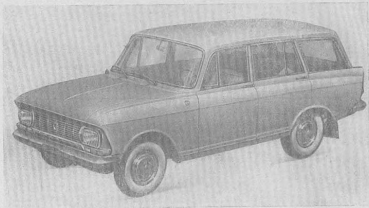
Рис. 2. Автомобиль «Москвич» модели 427