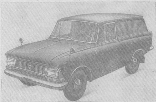
Рис. 3. Автомобиль «Москвич» модели 434