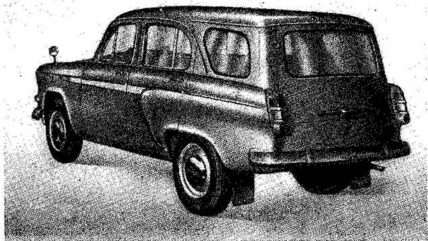
Фиг. 4. Автомобиль «Москвич-424» с кузовом универсал.