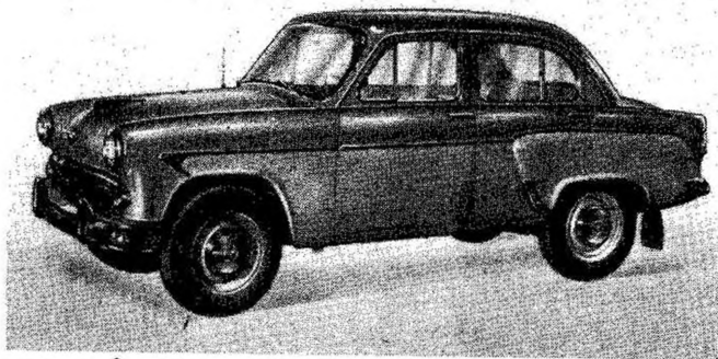
Фиг. 1. Автомобиль «Москвич-403».