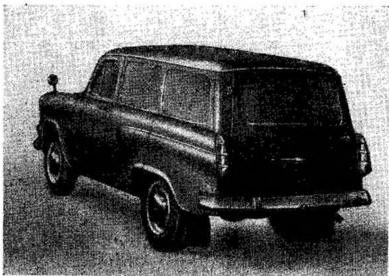
Фиг. 5. Автомобиль «Москвич-432» с кузовом фургон.