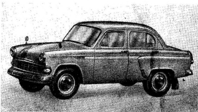
Фиг. 2. Автомобиль «Москвич-403» в экспортной исполнении.