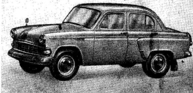
Фиг. 2. Автомобиль «Москвич-403» в экспортном исполнении.