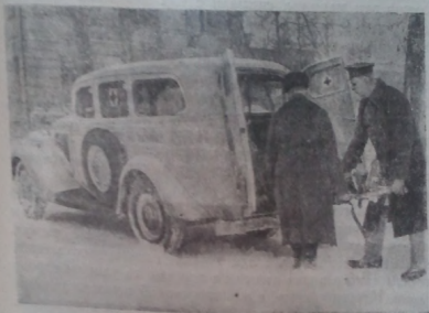
Рис. 38. Легковая машина М-1, приспособленная для санитарных целей

Можно приспособить для перевозки одного носилочного больного и машину М-1 (рис. 38), для чего приходится разрезать и удлинить ее кузов. Задние дверцы и носилки делаются так же, как и на ЗИС-101. Одна такая машина работает несколько лет на эвакуационном пункте Мосгорздраотдела по перевозке больных. Для скорой помощи она непригодна, так как внутри кареты имеется лишь два места, а с машиной скорой помощи, кроме врача и двух помощников, обычно едет кто-либо из сопровождающих пострадавшего.