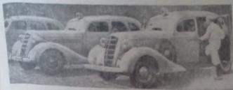
Рис. 35. Легковая машина ЗИС-101, приспособленная для работы на станции скорой помощи

Незадолго до войны Московская станция скорой помощи стала получать машины ЗИС-101 (рис. 35). К сожалению, мы никак не могли получить эти машины с кузовами без