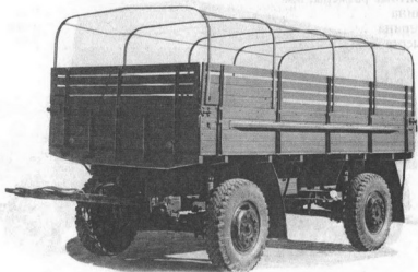
Рис. 36. Автомобильный прицеп СМЗ-782В (2-ПН-4М)

Основные тяговые автомобили . . . . . Урал-375Д, Урал-375Н, Урал-4320