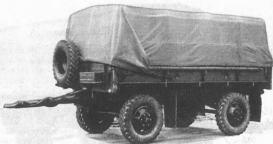
Рис. 34. Автомобильный прицеп СМЗ-8325 (2-ПН-2М)