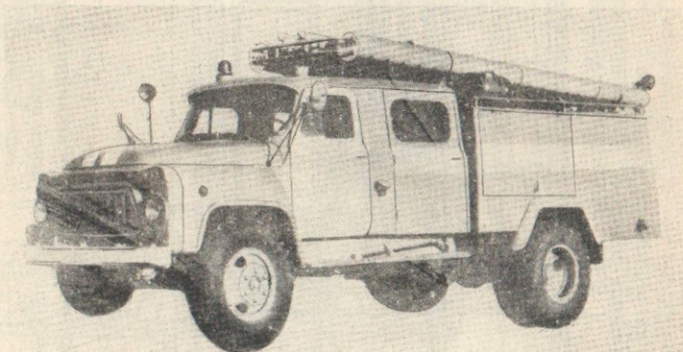
Рис. 1. Пожарная автоцистерна АЦ-30(5312), модель 106Г

Автоцистерна рассчитана на эксплуатацию в районах с умеренным