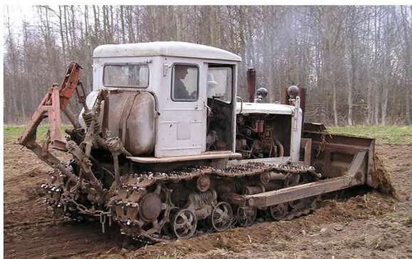
Рис. 2. Вид трактора сзади.