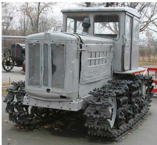
Рис. 1. Вид трактора спереди.