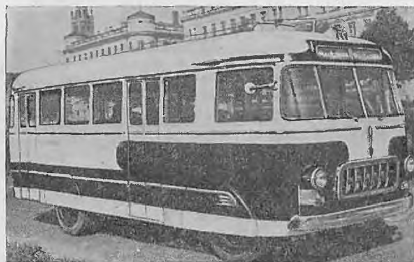
Рис. 5. Автобус РАФ-251

Новые автобусы по мере внедрения их в народное хозяйство позволят значительно повысить эффективность и экономичность перевозок и тем самым будут способствовать выполнению работниками автотранспорта Директив XX съезда КПСС.