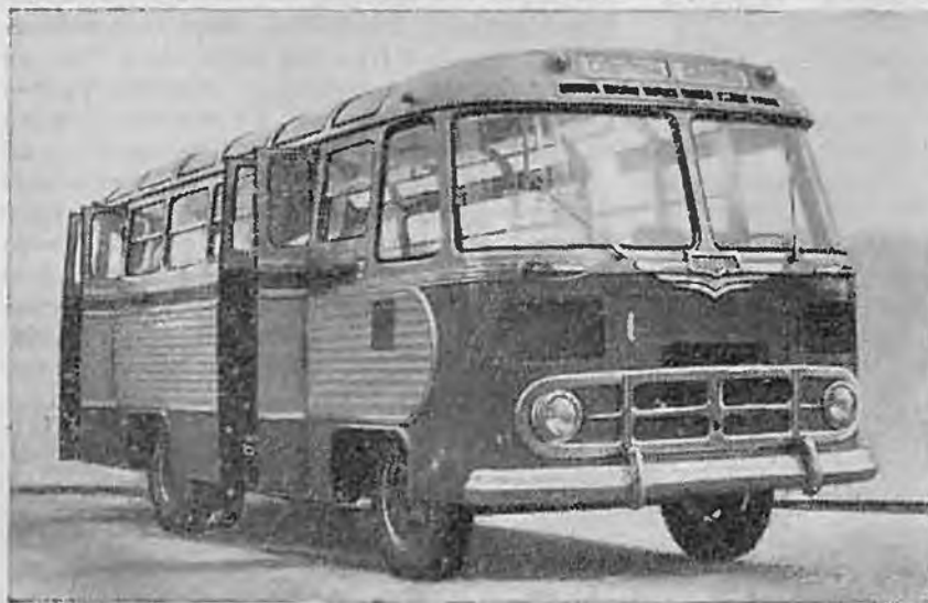
Рис. 4. Автобус ПАЗ-652

На базе кузова и ходовой части междугородного автобуса ЗИС-127 спроектирован и новый автобус ЗИС-129, предназначенный для эксплуатации в городских условиях. По внешнему виду