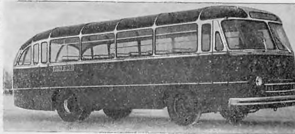
Рис. 2. Автобус ПАЗ-695 «Львов»

Новинку представляет собой усилитель руля 8. Усилие на штурвал руля является лишь командным, воздействующим на следящий механизм усилителя, который имеет гидравлический привод и осуществляет поворот колес. Такой гидроусилитель заметно облегчает труд водителя автобуса и повышает надежность движения, в особенности при падении давления в передних шинах.