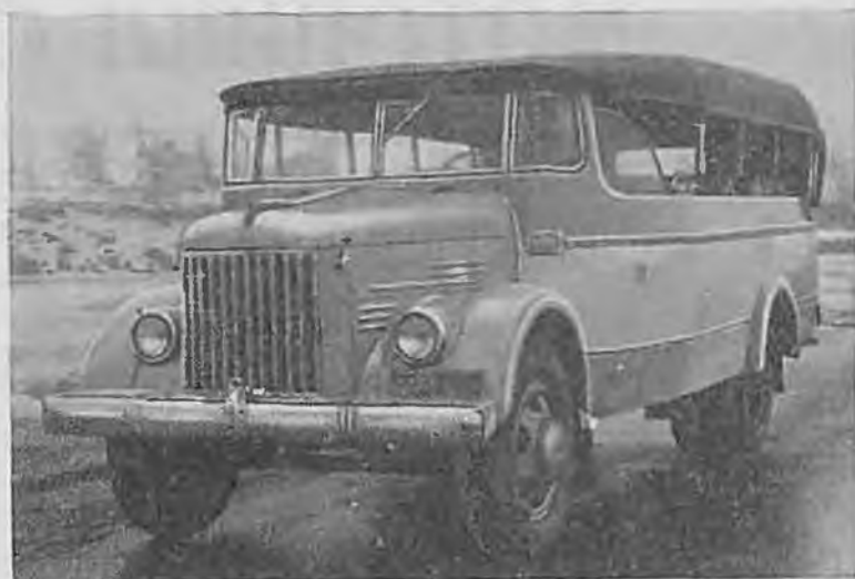
Рис. 6. Автобус Сочинского автотранспортного управления

Общая вместимость рижского автобуса — тридцать мест, из них двадцать два для сиде-