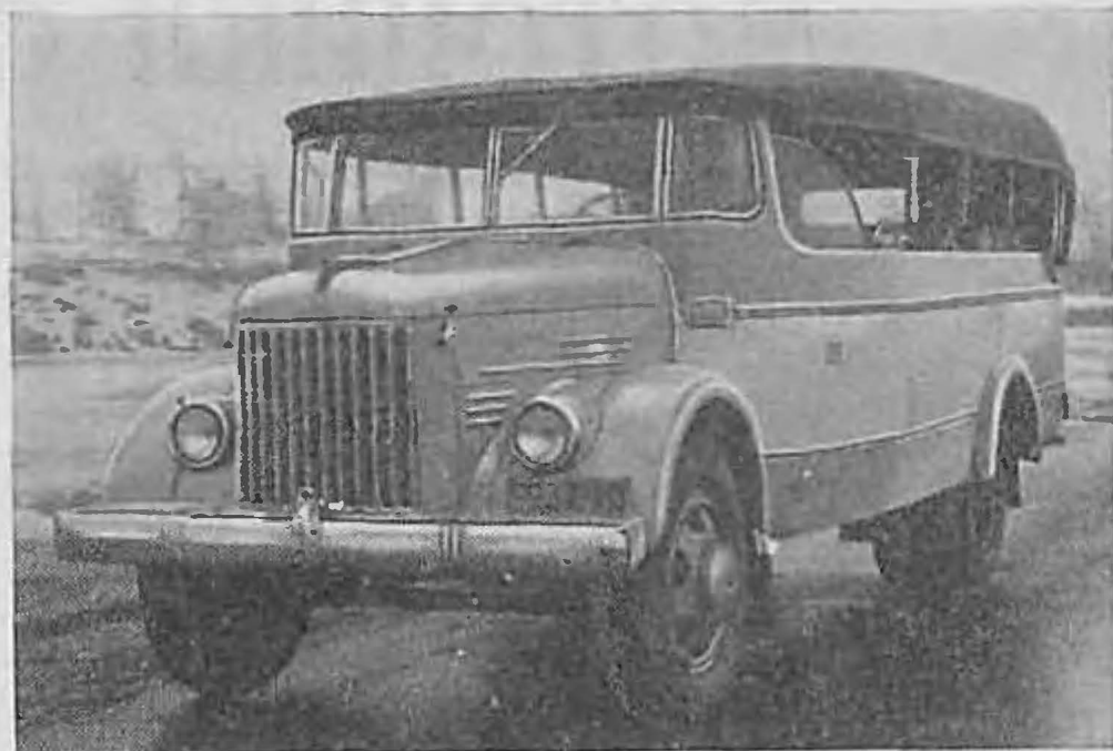
Рис. 6. Автобус Сочинского автотранспортного управления

Общая вместимость рижского автобуса — тридцать мест, из них двадцать два для сиде-