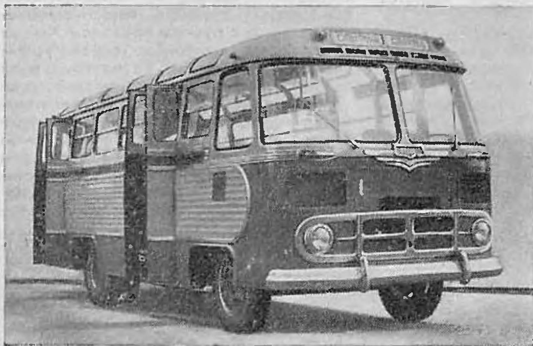
Рис. 4. Автобус ПАЗ-652

На базе кузова и ходовой части междугородного автобуса ЗИС-127 спроектирован и новый автобус ЗИС-129, предназначенный для эксплуатации в городских условиях. По внешнему виду