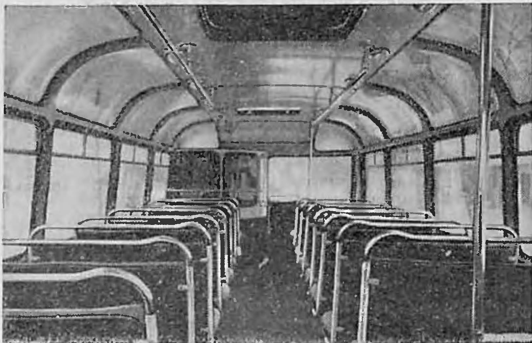
Рис. 3. Пассажирский салон автобуса «Львов»

На лобовой части кузова автобуса вверху установлен мощный прожектор, освещающий дорогу на расстоянии 200 м. Место водителя и пассажирский салон разделены стеклянной перегородкой, которая на ночь закрывается плотными шторами.