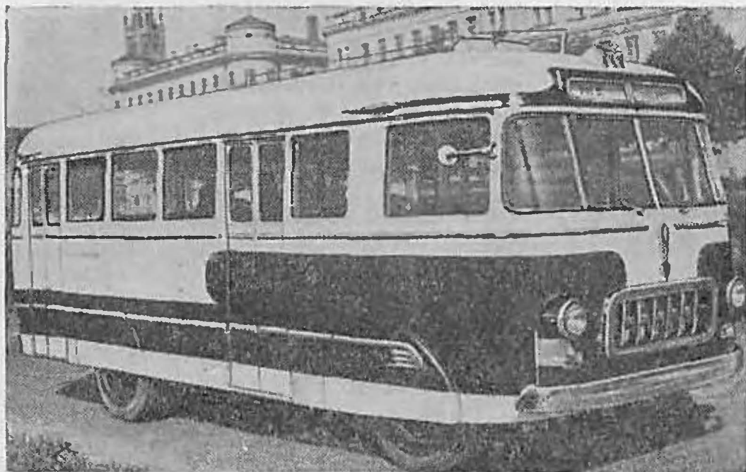
Рис. 5. Автобус РАФ-251

Новые автобусы по мере внедрения их в народное хозяйство позволят значительно повысить эффективность и экономичность перевозок и тем самым будут способствовать выполнению работниками автотранспорта Директив XX съезда КПСС.